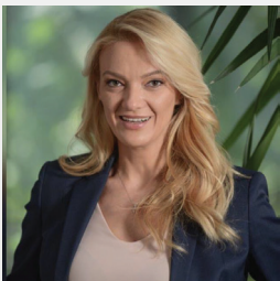
Citim nga ekspertët e AASF

diskutim të gjallë se si agrobizneset mund të aksesojnë në shërbimet ekzistuese dhe produktet nga këto institucione. Për shkak të kërkesës së lartë ndërkombëtare për BMA, sektori kërkon investime më të mëdha me qëllim rritjen e kapaciteteve në funksion të përballimit të kërkesës që vjen nga eksporti.